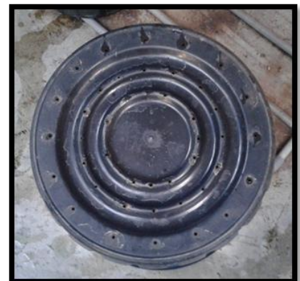
Rajah 3. Lubang tong pencambah