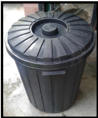
Rajah 1. Tong pencambah tauge